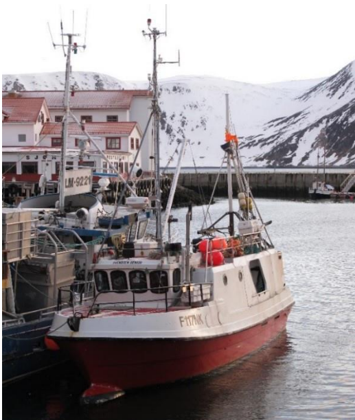
Figur 2: Fiskebåten Svendsen Senior .