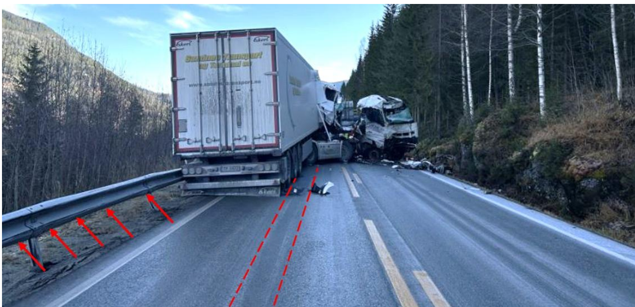
Figur 3: Kjøretøyenes sluttposisjon, skrapemerker på veirekkverket langs nordgående kjørefelt (røde piler) og antydning til bremsespor etter Scania-vogntoget (røde stiplede linjer). Fotoet er tatt ca. 28 minutter etter at ulykken skjedde. Illustrasjon: SHK