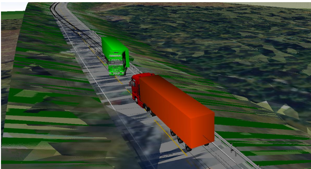
Figur 5: Illustrasjon fra simulering av ulykken. Illustrasjon: SHK