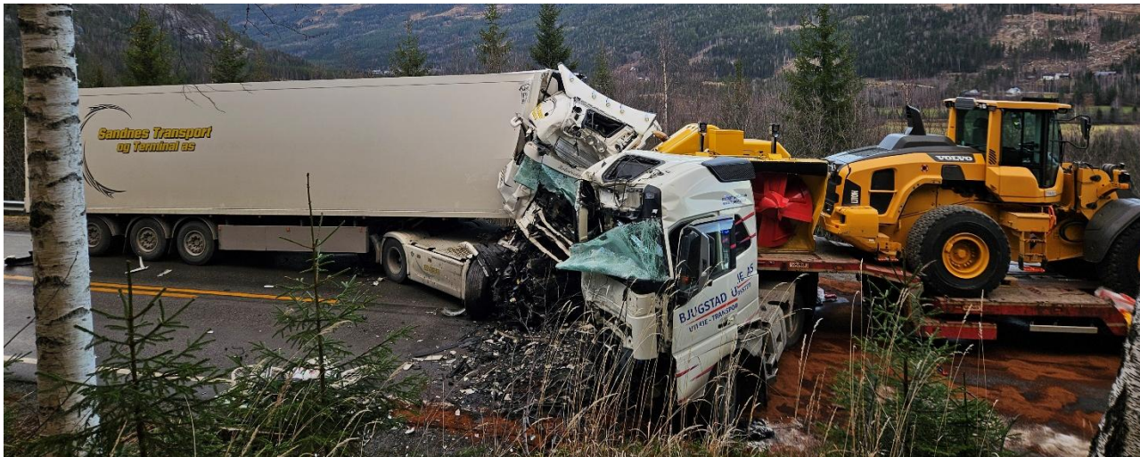
Figur 2: Scania-vogntoget til venstre. Volvo-vogntoget til høyre. Fotoet er tatt fem timer etter at ulykken inntraff.

Begge kjøretøyene fikk store skader i kollisjonen (se figur 2). Førerhyttene til begge vogntogene ble svært sammentrykket, men det var delvis overlevelsesrom. Føreren av Scania-vogntoget ble meget alvorlig skadet. Passasjerer i Volvo-vogntoget ble alvorlig skadet og føreren av Volvo-vogntoget fikk mindre fysiske skader. Det var skrapemerker på veirekkverket langs nordgående kjørefelt og antydning til bremsespor etter Scania-vogntoget på veibanen (se figur 3).