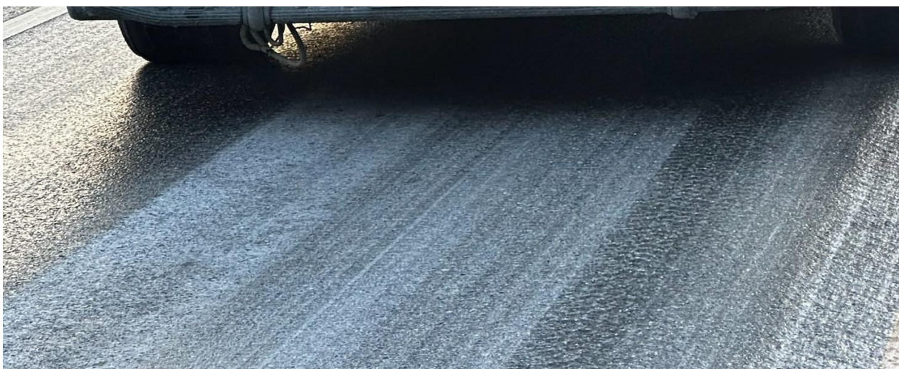
Figur 4: Motgående kjørefelt ca. 150 m fra ulykkesstedet, sett i Scania-vogntogets kjøreretning. Fotoet er tatt ca. kl. 0830.