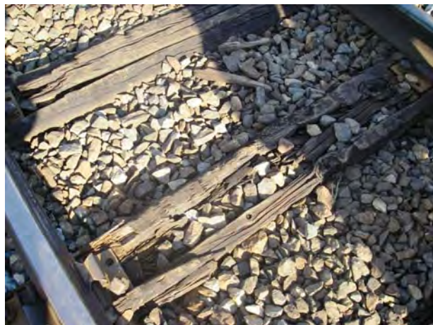
Figur 5: Flere tresviller i dårlig forfatning.

Ved km 86,96 ble det funnet avsporingmerker på høyre skinne som tydet på at et hjul hadde falt ned på innsiden av skinnestrengen i dette området. De påfølgende sviller viste økende grad av ødeleggelse fra hjulets flenser inntil svillene var totalt ødelagt og skinnestrengene ikke lenger hadde forbindelse gjennom svillene.