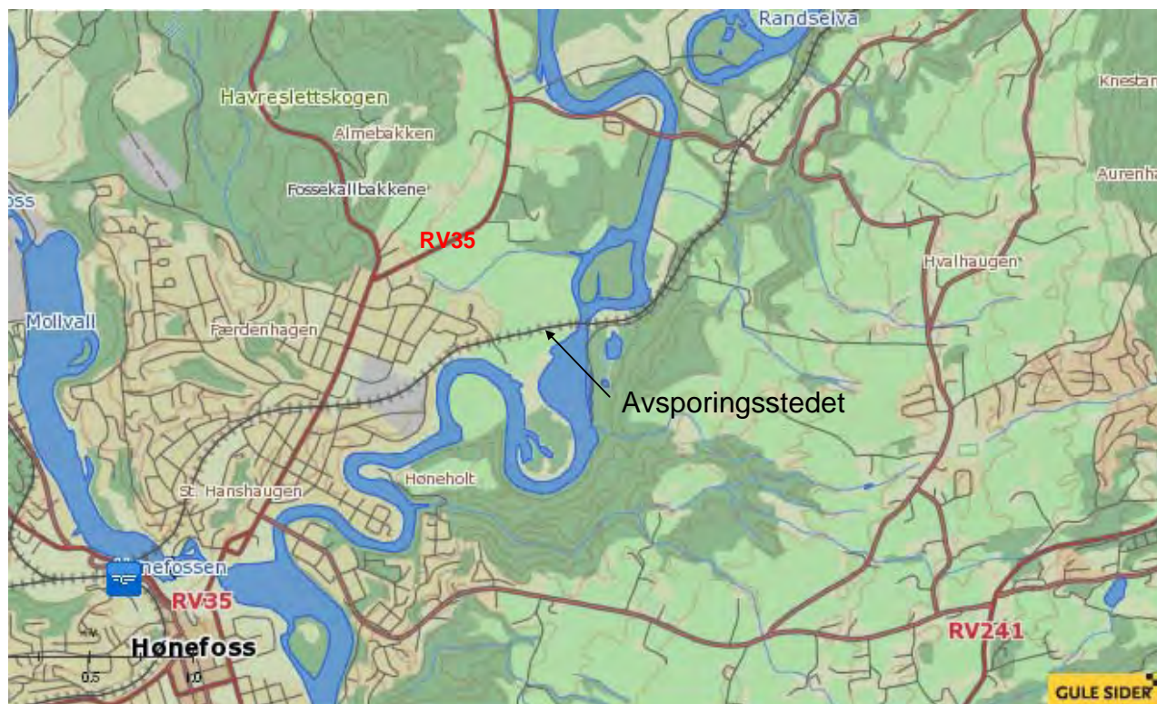
Figur 3: Kart over avsporingsstedet.