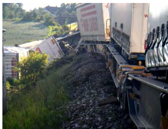
Figur 2: Avsporede og veltede vogner sett forover i toget.