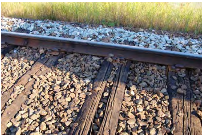
Figur 4: Tresvillene fra 1961 var generelt i dårlig forfatning.