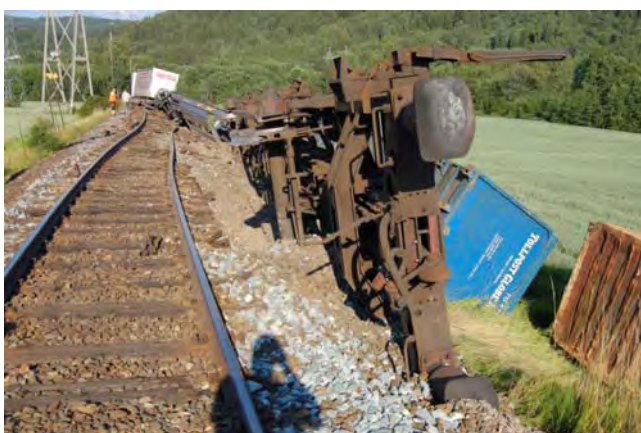
Figur 1: Avsporede og veltede vogner sett bakover i toget.

Toget var ca 30 minutter forsinket ved passering av Hval stasjon. Etter passering av en bro over Randselva merket lokomotivfører et lite rykke i toget og så i speilet at det støvet bak toget. Han forstod at det hadde skjedd en avsporing og tok nødbrems. Etter nok et rykk stoppet toget. Lokfører varslet togleder om avsporing, gikk deretter bak og kunne konstatere at toget hadde delt seg og flere vogner hadde sporet av og lå på siden.