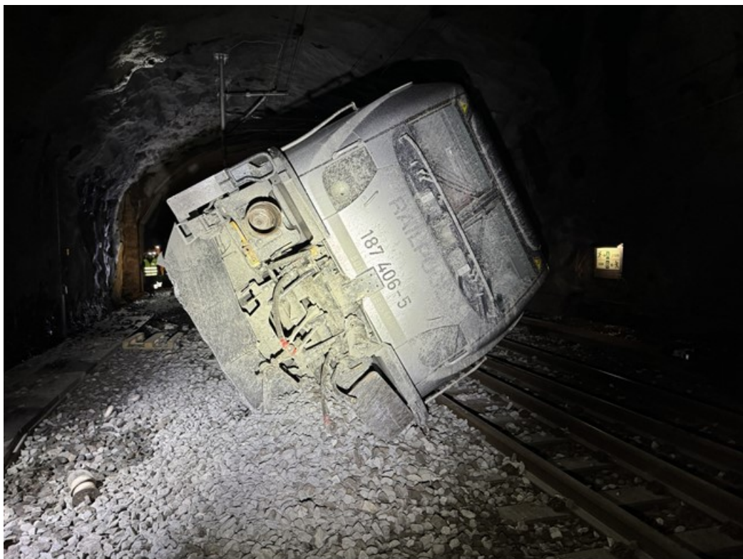
Inne i tunnelen.